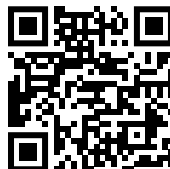
Место проведения Конгресса